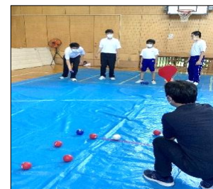
一球入魂！狙いを定めて投球します。

エンジョイスports部では、様々なスポーツに親しむことを主なねらいとし、ボッチャを中心に活動していきます。第1回目の部活動では、部長・副部長を決め、ボッチャのルール確認をしたり、試合を体験したりしました。ボールを一つ投げるたびに歓声が上がり、最後まで試合に集中して参加する姿が見られました。様々な人と一緒にスポーツをすることを通して、体を動かすことの気持ちよさを感じたり、コミュニケーション能力や新しいことに挑戦する気持ちを身に付けたりできるように頑張ります。