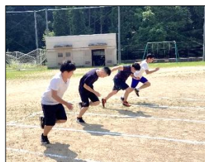
良いスタートダッシュが切れるように、姿勢などを確認しながら繰り返し練習しています！

アスリートSports部では、自己記録の更新や陸上大会やフライングディスク大会などのスポーツ大会へ出場することを目標に活動していきます。陸上練習は、短距離走・中長距離走・投てきの3種目に分かれて行います。生徒自身が大会に出場したい、記録を伸ばしたいと考えている種目を選んで参加します。第1回目の練習では、3種目に分かれて練習を行いました。それぞれの練習メニューを提示すると、生徒同士で言葉を掛け合って主体的に練習を進めていく姿が見られました。9月にある全京都障害者スポーツ大会(陸上大会)を目指して、良い結果が出せるように部員全員でチームとなって頑張ります。