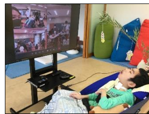
他学部の発表にも興味をもってしっかりと画面に注目することができました。

小・中学部とリモートでつながり、合同七夕コンサートを行いました。短冊の願い事を発表したり、「♪たなばたさま」を皆で歌ったり、音楽で取り組んでいることを発表したりしました。高等部1・2組は、「♪にじいろ」を手話歌やスカーフを使って表現したり、「♪幸せなら手をたたこう」の曲に合わせて一人ずつ選んだ楽器を演奏したりしました。3年生の二人は最高学年として、司会や挨拶を担当し、自信をもってスイッチを押したり、笑顔を見せたりしながら進行することができ、小・中学部の後輩達にカッコイイ先輩の姿を見せることができました。