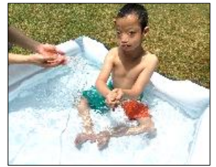
外気の暑さと水の気持ちのよい冷たさなど、“夏”を全身で感じる事ができました！

季節の学習として“夏”を味わうことをねらいに、「海」をテーマにした様々な活動に挑戦しました。はじめに、海の雰囲気や生き物を知るために、「海の絵」と「ビニールクラゲ」の制作をしました。「海の絵」では、画用紙に海のイメージの色を選び、カラーペンで塗ったり、指先で砂を触ってザラザラした感触を確かめながら貼ったりしました。「ビニールクラゲ」では、ビニール袋をカスタネットバサミで切ってクラゲの足を作り、折り紙をちぎって胴体になる袋に入れて仕上げました。そして「水遊び」では、海水浴のイメージでプールの水面を揺らし、その冷たさや水の感触を心地良く感じる事ができました。今後も制作や屋外での活動の中で、四季折々の自然に触れる体験を通して、季節の移り変わりを感じられるよう学習していきます。