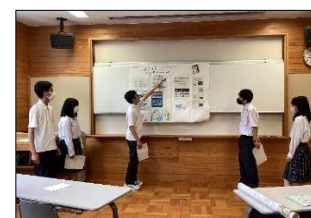
自分たちで調べたことを壁新聞にまとめることで、情報が整理され、さらに理解が深まりました。

総合的な探究の時間では、生徒が主体的に学ぶことを目的として、調べ学習を行っています。1学期は、「地震が起きたとき、どのように対応すればよいか」をテーマに、「過去5年間に震度4以上を観測した都道府県」「地震と津波の起こり方」「大飯原発から放射能漏れが起こったら」「地震への対応と対策」の4グループに分かれてインターネット等で調べました。調べていく中で、「これはどうなるのだろう？」と興味の幅を広げたり、「こんな記録があった！」と新たな発見に驚いたりしながら、主体的に学ぶ姿が多く見られました。調べた内容は、グループごとに壁新聞でまとめ、発表しました。記事の配置や色、イラストなどを工夫して分かりやすく見やすい壁新聞を作成し、相手に分かりやすい言葉で発表ができるよう自分たちで考えて発表することができました。