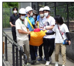
教職員は、担架を使って傷病者を運ぶ訓練も行いました。

実際に災害に遭遇した際に落ち着いて対応できるよう、今後も年間を通して様々な災害を想定した避難訓練を実施し、防災意識の向上を目指していきます。