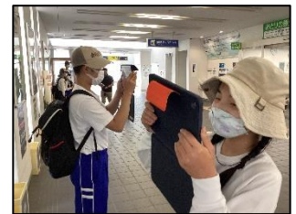
公共のマナーを守って、池内バスに乗り、西舞鶴駅まで行くことができました。