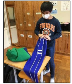
ズボンのセンタークリースの位置に合わせて畳むことができるように練習をしました。

アルセウス、B.T.S グループはタンバリンやトライアングル、木琴・鉄琴やキーボード等を順番に体験し、自分が担当したい楽器を選んでいきます。それぞれに練習を重ね、合同授業の際に合奏を予定しています。どのようなハーモニーになるのか楽しみです。自分の心に「耳をすまし」、それぞれ自分の「原石」を見つけて磨いてほしいと思います。