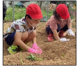
畑の畝に溝を掘って、さつまいもの苗にやさしく土をかぶせます。

今後は秋の収穫に向けて、各学級で分担して水やり・草引きを行いながら、苗の成長を観察したり、地域の方と交流したりします。