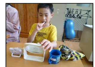
鏡で確認しながら歯を磨きます。磨きたい歯にしっかりと歯ブラシを当てて磨くことができました。