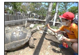
「テレビで見るより大きいね！」動物たちにちょっとドキドキしながら間近で餌やりをしました！