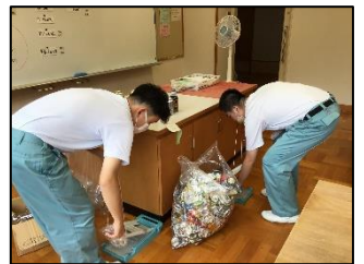
黙々とアルミ缶とペットボトルを潰す作業をしています。

実習のまとめでは、頑張ったことを発表し、やりきったという実感のある3日間を終えることができました。この実習で学んだことを夏休みの実習に生かしていきます。