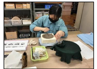
集中して指先を動かし、製品作りに取り組んでいます。

閉社式では、5日間の成果と課題をまとめて発表することができました。今後は校内実習での成果と課題を忘れることなく学校生活を送り、さらに自分の進路実現に生かして行きます。