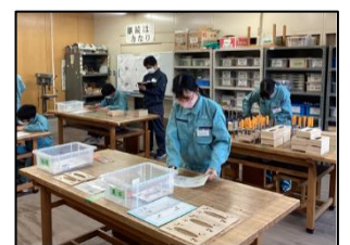
自分の仕事に責任をもって取り組みます。