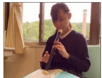
指使いや息の出し方に注意しながら、練習しています。