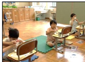
段ボールを敷いたり、椅子を机代わりにしたりして喫食しました。