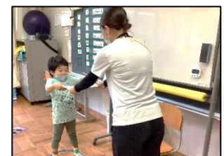
チャレンジ期間を終え、表彰状をもらいました！よく頑張りました！

取組終了後には、各学級で表彰し、互いの頑張りを讃え合いました。「にこにこチャレンジ」は、2学期、3学期にもあります。次回も児童の力を育む機会となるよう、そして、今回取り組んだことを習慣化し、自信をつけて様々なことにチャレンジしていけるよう、指導していきます。