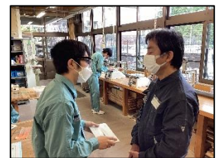
大きな声で分かりやすく上司役の指導者に相談や報告をします。

校内実習での学びをしっかりと振り返り、職場実習で成果を最大限に発揮できるよう頑張ります。