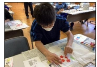
型の配置や色を考えてやさしくトントンと色を付けていきました。