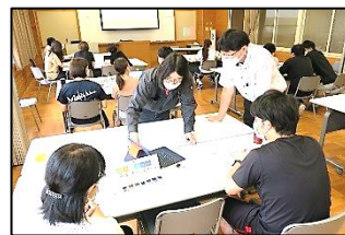
試行錯誤して柔軟に考えることの重要性を学びました。

「教職員のプログラミングに関わる知識、技能の向上を図り、授業実践に生かす。」をねらいに、舞鶴工業高等専門学校の先生方や生徒の方に来校いただき、感染症対策をとりながら出前授業を実施しました。今年度は、「ME SH(メッシュ)」というアプリを使っただけの講座でした。Bluetooth(無線)で7種類のセンサーやスイッチなどと関連づけることを学習した後に、「I F T T T (イフト)」というアプリとも連携させてGPSを利用したプログラミングを体験しました。タブレット端末上の簡単な操作で、GPSから位置情報を得て、ME SHと関連付け、LEDを点灯させるなどができました。グループごとに教職員同士が相談しながら、プログラムを組むことができました。