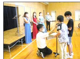
すてきな演奏をしていただき、ありがとうございました。