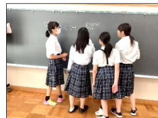
「漢字、どう書くんやっけ？」 「これであって？」と、グループを越えて、楽しげに黒板に飾り付ける姿がありました