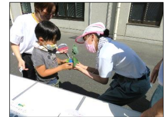
目線の高さを合わせて、相手の顔を見ながら、接客をしています。

当日は、自分たちで販売する苗を運び、机を並べる等、会場のセッティングからスタートしました。販売では、久しぶりの接客で緊張した様子の生徒も見られましたが、「相手に目線を合わせること」「苗を優しく触ること」を意識して接客に取り組みました。小学部の児童が苗を買いに来てくれたときには、やさしい言葉で接客したり、児童のところまで行って膝を曲げて目線を合わせて注文を聞いたり、丁寧な接客をすることができました。多くの方に苗を購入していただき、生徒たちにとって充実した販売学習となりました。