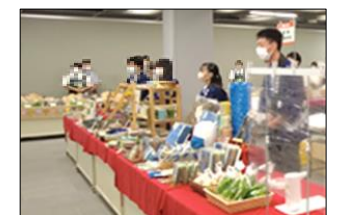
「五大行動」と「八大用語」を意識し、真心をこめて接客を行いました。