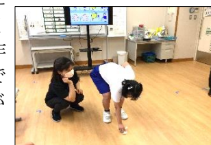
2つの役割に分かれてペアで協力してプログラミングの仕組みを学習しました。