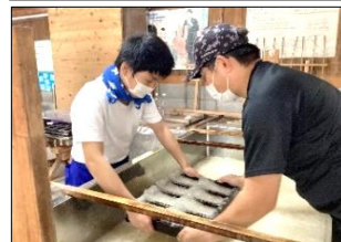
「黒谷和紙会館」の方からの説明をよく見て聞いて、木の枠を入れる角度が大事なことを教わりました