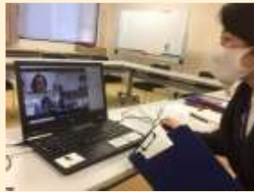
リモートによる打ち合わせ

各地域の地域支援センターと連携しながら府専門家チーム委員に依頼をし、専門的な知見から、子どもの状態の見立てや各学校内での支援等について御助言をいただきました。