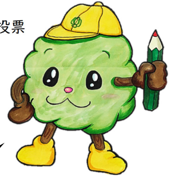
くすのき小オリジナルキャラクター のっきー

くすのき小のいろいろな所や場面に登場して活躍しており、くすのき小の子どもたちにとってお馴染みのキャラクターとなっています。ぜひ、参観等で来校された際には、探してみてください。