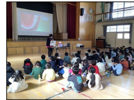
歯磨き巡回指導（1年）