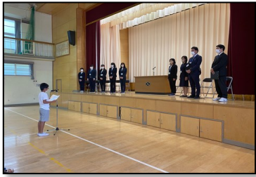
着任式で児童会から歓迎の言葉が送られました

4月6日(木)、3年ぶりに体育館で集合型の始業式を行い、新2～6年生が一堂に会しました。翌7日(金)、83名の新1年生を迎えたことで、全校578名がそろい、いよいよ令和5年度の久世小学校がスタートしました。毎日の授業があわたくしが行われながらも、学校全体に活気が満ち溢れ、いよいよ日常が戻ってきています。