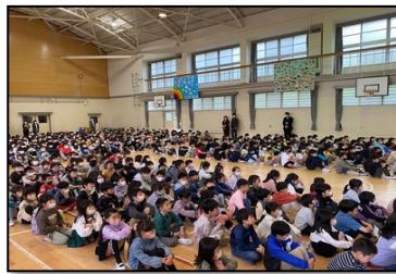
始業式で校長先生の話静静地に聞くことができました

さて、そうした活気に満ちあふれ始めた今年度の久世小学校では、重点研究として、次のことを大事にしていきます。