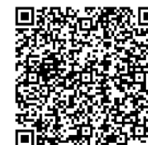
欠席連絡用QRコード