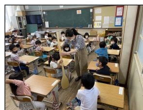
栄養教諭による 給食のつくり方