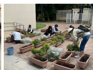
PTA学級環境委員による花の 植え替え準備