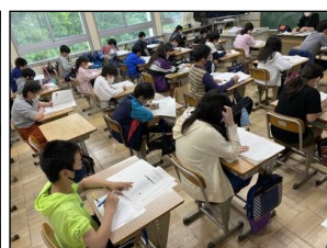
全国学力・学習状況調査 (6年)