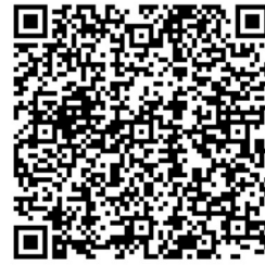
欠席連絡用アドレスのQRコード

2月15日に配付したプリント「欠席連絡方法の変更について(お願い)」で、欠席連絡をメールで行うことができるようになったことをお伝えしました。下記の点について再度ご確認ください、ご活用ください。