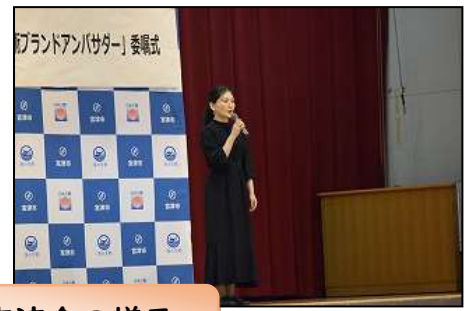
文化芸術交流会の様子