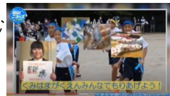
SDGsの取組の協力を園所に発信