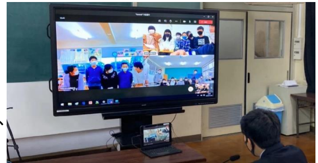
久美浜学園児童会・生徒会合同定例会議(1中学校3小学校)