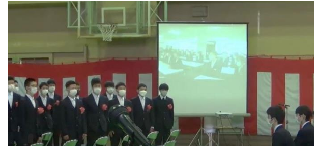
体育館と別会場を結んだコロナ禍の卒業証書授与式

また、オンデマンドや動画配信などは、教員や児童生徒のスキル向上により、対面では得られない情報量や表現力も魅力となり、教師のみならず、子ども同士のネットワークの構築と活性化も実現しています。