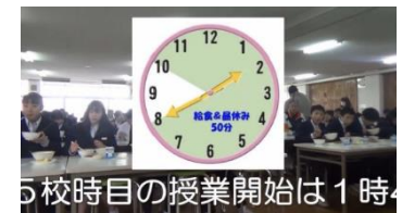
5校時目の授業開始は1時 中学校入学に当たった質問に回答