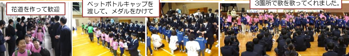
3園所で歌を歌ってくれました。