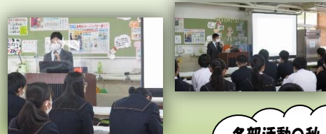
各部活動の秋季大会等の結果は12月号で