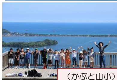
(かぶと山小) かぶと山、小天橋駅、梨園など