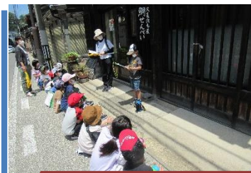
(久美浜小) 校区めぐりで如意寺、煎餅屋さんなど