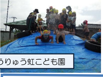
こうりゅう虹こども園

田んぼの稲の草取りに行きました。園庭の玉ねぎも収穫しました。大きな玉ねぎが採れました。園庭の山でウォータースライダーも楽しみました。