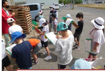
(高龍小) 校区めぐりでJA、駐在所など

コロナの影響で、なかなか校外学習ができない状況が続いていましたが、学園の会議で小学校の校長先生が「今、地域へ出での学習や地域のボランティアの活動を進め、地域とつながることを頑張っています。」と言われたので、各学校に頼んで、校外学習の写真を送っていただきました。小学校から10種類集まりました。一部ですが、紹介します。