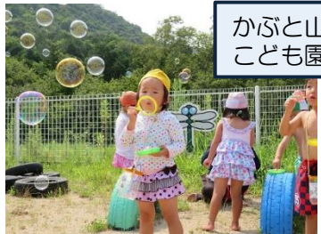
かぶと山 こども園