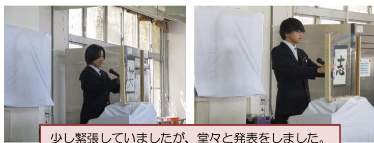
少し緊張していましたが、堂々と発表をしました。

「立志式」は元服にちなんで14歳をお祝いする行事です。将来の目標や決意を明らかにします。中学校2年生が、目標や決意を漢字を示しながら、一人一人発表しました。保護者や教育委員会の方にも聞いてもらいました。