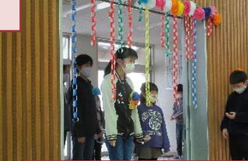
1年生が会場へ案内しました。