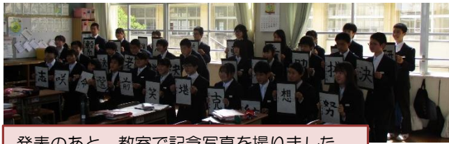
発表のあと、教室で記念写真を撮りました。

「立志式」は元服にちなんで14歳をお祝いする行事です。将来の目標や決意を明らかにします。中学校2年生が、目標や決意を漢字を示しながら、一人一人発表しました。保護者や教育委員会の方にも聞いてもらいました。