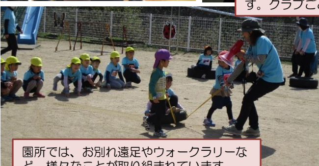
園所では、お別れ遠足やウォークラリーなど、様々なことが取り組まれています。