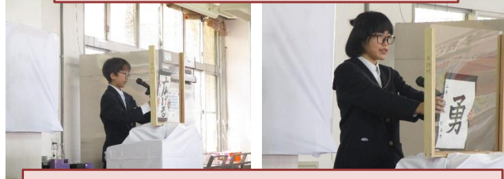
職業調べて学んだことをもとに、将来の目標や今頑張ることなどをしっかりまとめました。