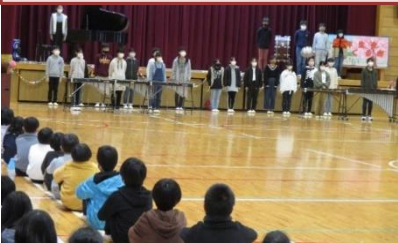
6年生がお礼の言葉と合奏を披露しました。在校生の呼びかけもありました。