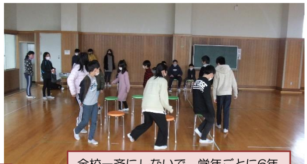
全校一斉にしなくて、学年ごとに6年生との「思い出づくり」をしました。