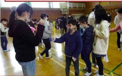
児童会で考えたゲームをしました。