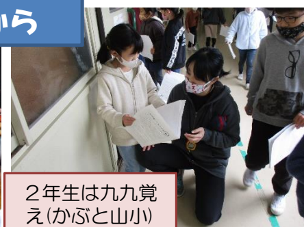
2年生は九九覚え(かぶと山小)