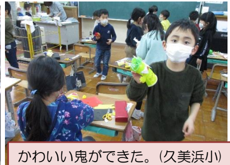
かわいい鬼ができた。(久美浜小)