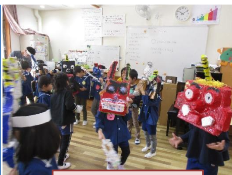
かぶと山こども園