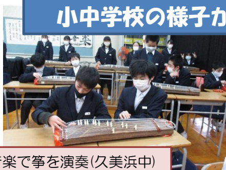
音楽で箏を演奏(久美浜中)