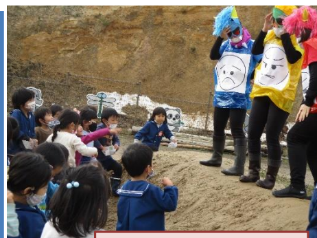
こうりゅう虹保育園