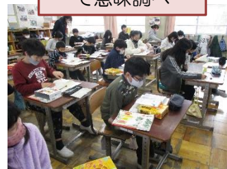
国語辞典を使って 意味調べ

中学生になると、テスト週間が年6回あります。その間、15日ぐらいは2、3時間以上集中して学習します。3年生になると部活動が終わった2学期から、自分の目標(受験)に向けて学習を続けます。自分で課題を決め、粘り強く、長期間学習できる力をつけていく必要があります。家庭学習がんばり週間は、そのための取組です。家で学習することが当たり前になるよう、また、コツコツ学びを続け、学びに向かう気持ちが確実に育つよう頑張っていきましょう。