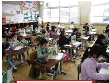
教科書を持って しっかり音読

達成率で見ると「寝る時刻」が74%とやや低いですが、他の4項目は8割になっています。「テレビ、ゲーム2時間以内」はやはり低く、今後も取組を強めていかなければなりません。後の3項目はほぼ9割の達成率です。