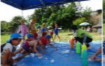
【おとまり保育】天女の里で魚つかみをして、園に帰ってお泊りをしました。キャンプファイヤーなどもしました。