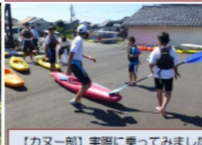
【カヌー部】実際に乗ってみました。