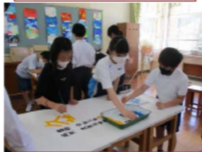
【クリエイト部】体育祭の立て看板を一緒に描きました。