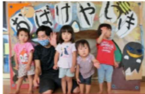
【きらきらわくわくデー】きりん組が小さい子たちをお店屋さんへ招待しました。水族館やおばけやしきもありました。

頑張って遊び場作りをしたので、途中の道で、女神さまから温泉の入浴券をもらいました。地域の温泉のお湯をもらってきて、園に帰って温泉につかりました。