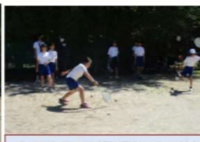
【ソフトテニス部】ラケットの持ち方から始まりストロークまでやりました。