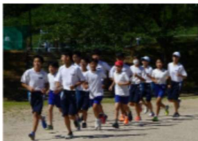
【陸上部】長距離と短距離に分かれて基礎練習です。