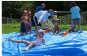
【プールカーニバル】山からすべり台、ゴールで水遊び、シャボン玉やヨーヨーつりもしました。