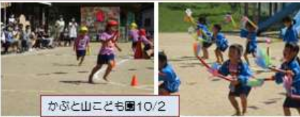
かぶと山こども園10/2

2週間のブロックでの取組のあと、体育祭が実施されました。台風の日、大縄跳び、学年別リレーなど、高いレベルで見ごたえのある競技が続きました。終わってから、リーダーとしてブロックをまとめた3年全員で記念写真です。