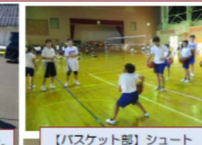
【バスケット部】シュートやドリブルも体験しました。