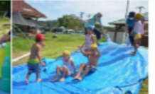
【プールカーニバル】氷のボーリング、ウォーターライダー、大喜びでした。

お泊りの翌朝には、地域のお寺の住職さんに来ていただいて、座禅をしました。心を落ち着けて静かな時間を過ごしました。5歳になると、こんなことができるようになります。