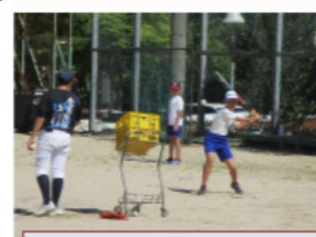
【野球部】トスパッティングです。