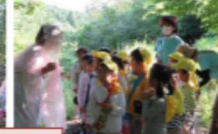
【わくわく体験デー】5歳が新しい山の遊び場作りをしました。

頑張って遊び場作りをしたので、途中の道で、女神さまから温泉の入浴券をもらいました。地域の温泉のお湯をもらってきて、園に帰って温泉につかりました。