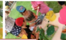
【ボディペインティング】絵の具がぐにゅぐにゅ、気持ちよさそうです。

昨年の5歳の人がしてくれたことを覚えていて、きりん組さんがお世話をして小さい子を楽しませてくれました。「ありがとう、楽しかった」と大盛況でした。