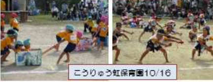
こうりゅう虹保育園10/16

好天の中の運動会です。保護者限定の参観であったり学年ごとであったり園所で方法は違いますが、実施できました。小中のようにチームで競い合うことはありません。一人一人が、日頃の遊びの中でできるようになったことを、精一杯発表しました。難しいことは何回でも挑戦しました。