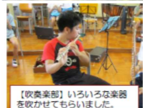
【吹奏楽部】いろいろな楽器を吹かせてもらいました。