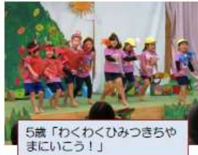
5歳「わくわくひみつきちやまにいこう！」