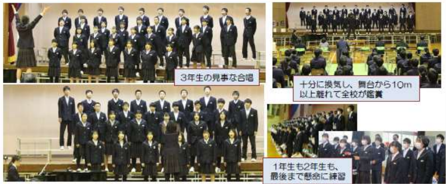
3年生の見事な合唱