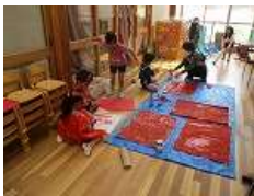
(かぶと山こども園)