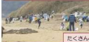
たくさんの漂着ごみの回収をしました。

中学校1年生が、地域学習の一環として浜清掃を行いました。市の生活環境課の方にお世話になりました。