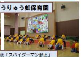
こうりゅう虹保育園