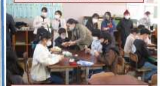
金融関係にお勤めの方の銀行の話