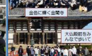
大仏殿前をみんなで歩いて