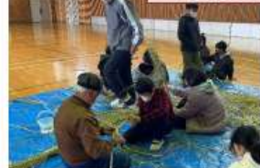
地域の方に教えてもらって