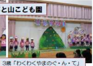
かぶと山こども園