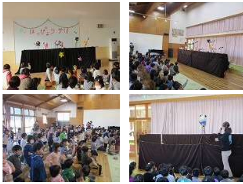
(久美浜保育所) (かぶと山こども園)

園所で、いもむしダンスの人形劇がありました。 子育て支援センターで作り子どもたちに見せた人形劇が とても好評だったので、市内の各園所でもしてほしいと お願いし、やってもらったということです。 確かにとっても楽しい人形劇で、 子どもたちも大喜びでした。