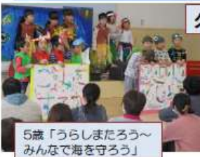
5歳「うらしまたろう～みんなで海を守ろう」

発表会をするかどうかというところから話し合いました。みんな「やりたい」というので、「どんなことをしたい」と聞きました。5歳では「太鼓と劇」でした。劇は、人数が多いので3つのグループに分かれて、自分たちで作った創作劇をしました。話し合うことを大切に、「思いを伝える」「折り合う」力を育てました。