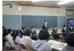
本部役員で協議（提案や振り返り）。その後、小学校の集いに中学生が行き説明。