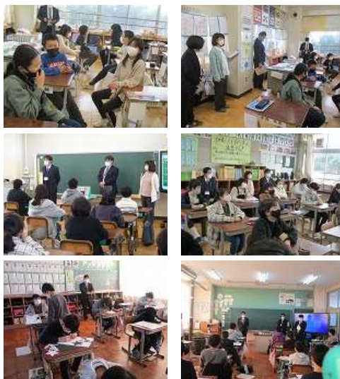
(かぶと山小) (高龍小) (久美浜小)

地域の民生児童委員さんの授業参観と懇談です。 学校の様子、子どもたちのことについて、 たくさん意見を聞かせてもらいました。