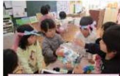
中学校探検のお礼にキャップを集める保育所。