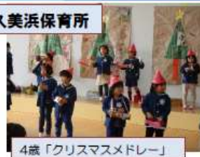
4歳「クリスマスメドレー」