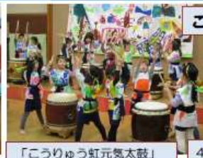
「こうりゅう虹元気太鼓」