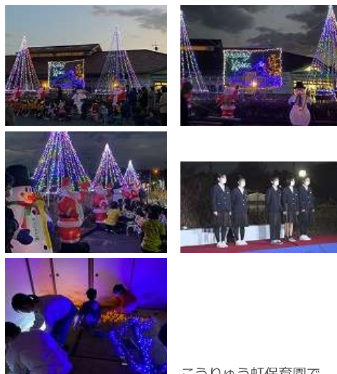
こうりゅう虹保育園で、イルミネーションの点灯式が行われました。