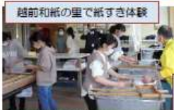
越前和紙の里で紙すき体験

それぞれの学校で、行き先や日程は違いますが、みんなで楽しく1泊2日の修学旅行に行ってきました。