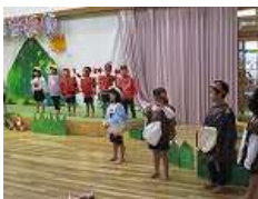
(かぶと山こども園)