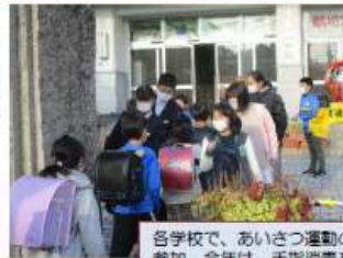
各学校で、あいさつ運動の取組。小学校へは、中学生が分担しながら参加。今年は、手指消毒をしながらあいさつ運動をする学校も。