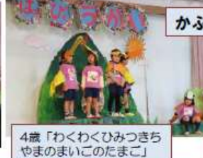
4歳「わくわくひみつちやまのまいこのたまご」