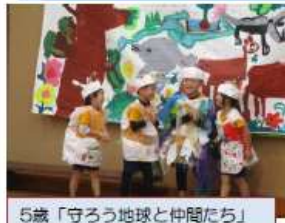
5歳「守ろう地球と仲間たち」

それぞれの学年が、今まで経験したことを取り入れてお話作りをしました。子どもたちが「こんなことをしたい！」という主体的な気持ちを大事にし、意欲を引き出しながら取り組んでいきました。5歳児は友達と一緒に同じ目的に向けて考えたり協力したりする楽しさを味わいました。