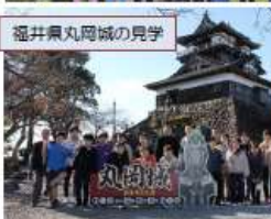
福井県丸岡城の見学