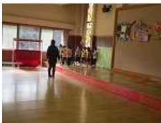
(こうりゅう虹保育園)

大道具作りも大変そうです。 ホールでの練習も、順番にやっています。 発表会準備で、どの園所も頑張っています。