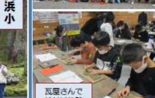
瓦屋さんと給付け体験