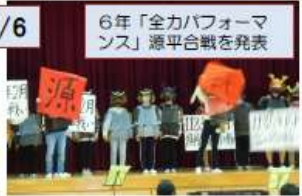
6年「全カパフォーマンス」源平合戦を発表

参観は各家庭2名までに制限し、低中高で3つに分かれて見てもらいました。それでも、広い体育館に多くの保護者の方が来られていました。我が子の発表を楽しみにして来られた方も多かったと思います。