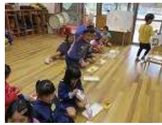
(かぶと山こども園)

5歳は、11月からお昼寝がなくなります。 午後も寝ないで活動します。 少しだけ寝るところもあります。 もうすぐ発表会もあるので、準備や練習をします。