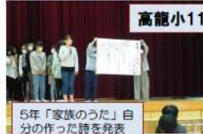
5年「家族のうた」自分の作った詩を発表