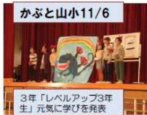
3年「レベルアップ3年生」元気に学びを発表

参観は各家庭2名までに制限し、低中高で3つに分かれて見てもらいました。それでも、広い体育館に多くの保護者の方が来られていました。我が子の発表を楽しみにして来られた方も多かったと思います。