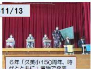
6年「久美小150周年、時代とともに」昔物で発表