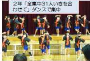
2年「全集中31人いきを含めて」ダンスで集中