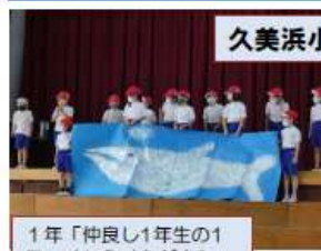
1年「仲良し1年生の1日」くじらぐもがきた

発表会に向けて毎日練習に励んできた子どもたち、それぞれが楽しく質の高い発表となりました。「挑戦」は2学期の全校のキーワードです。2日前には、リハーサルを兼ねて、子ども同士で発表し合い見る会をしました。