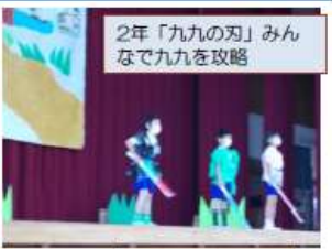
2年「九九の刃」みんなで九九を攻略

感染対策で各家庭2名以内、低・高学年2部制の参観となりました。6年生の発表にあるように、久美浜小は150年の歴史があります。そんな歴史の重みを感じさせるよい発表が続きました。