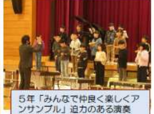
5年「みんなで仲良く楽しくアンサンブル」迫力のある演奏

発表会に向けて毎日練習に励んできた子どもたち、それぞれが楽しく質の高い発表となりました。「挑戦」は2学期の全校のキーワードです。2日前には、リハーサルを兼ねて、子ども同士で発表し合い見る会をしました。