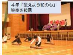
4年「伝えよう和の心」華奏を披露