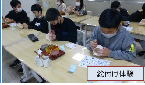
ルールを守りみんなの思い出に残る楽しい修学旅行になりました。