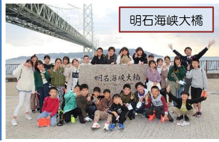
「人を大切にできる修学旅行」を目標に見学や体験をしました。