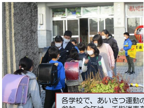
各学校で、あいさつ運動の取組。小学校へは、中学生が分担しながら参加。今年は、手指消毒をしながらあいさつ運動をする学校も。