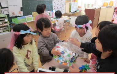
中学校探検のお礼にキャップを集める保育所。