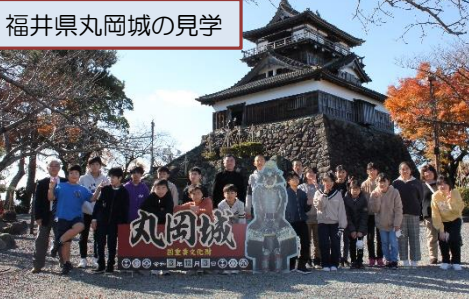
福井県の自然や歴史、特産物をいっぱい学んできました。