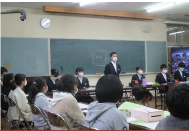
本部役員で協議（提案や振り返り）。その後、小学校の集会に中学生が行き説明。