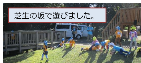
芝生の坂で遊びました。

今年も実施できた5歳児交流会。5歳になると、ずいぶん遅くなり、長い坂道を子どもだけのグループで登って行きます。すごく良い天気で、久美浜湾が一望できたり、眼下に見覚えのある家並みや建物が見えたりします。子どもたちの心に残る久美浜ならではの取組となっています。3園所を混ぜたグループをつくることは、事前準備が大変ですが、新しい友達ができるよい機会になっています。