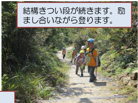
結構きつい段が続きます。励まし合いながら登ります。