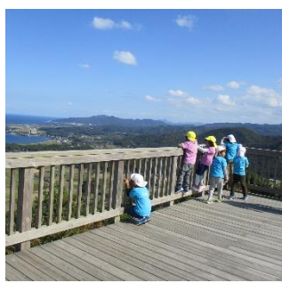
頂上に到着。見事な景色に見とれています。