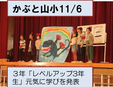
3年「レベルアップ3年生」元気に学びを発表