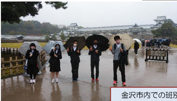
金沢市内での班別行動