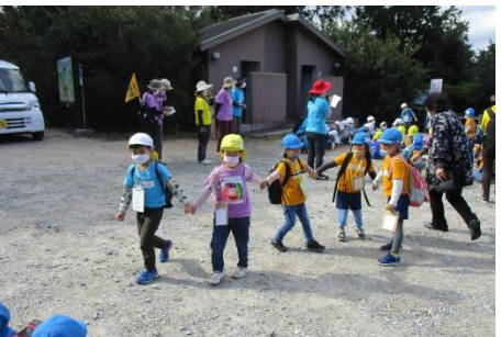
あらかじめ決めておいたグループ（3園所合同）になります。