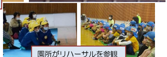
園所がリハーサルを参観

感染対策で各家庭2名以内、低・高学年2部制の参観となりました。6年生の発表にあるように、久美浜小は150年の歴史があります。そんな歴史の重みを感じさせるよい発表が続きました。