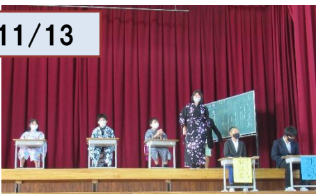
6年「久美小150周年、時代とともに」着物で発表