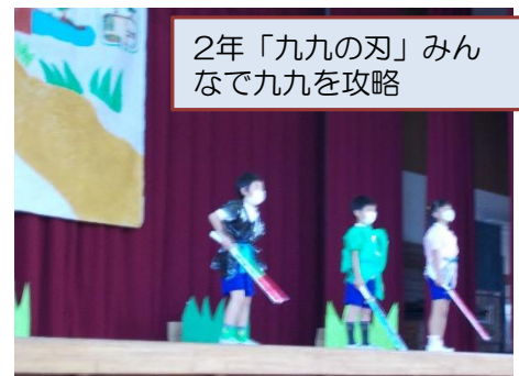
2年「九九の刃」みんなで九九を攻略

感染対策で各家庭2名以内、低・高学年2部制の参観となりました。6年生の発表にあるように、久美浜小は150年の歴史があります。そんな歴史の重みを感じさせるよい発表が続きました。