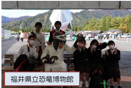
福井県立恐竜博物館