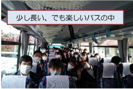
少し長い、でも楽しいバスの中