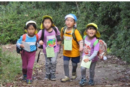
さあ、登山開始。途中で様々なミッションをクリアしなければなりません。