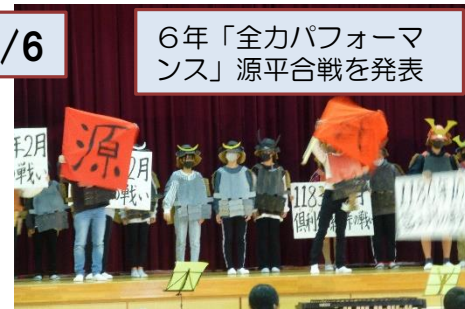
6年「全カパフォーマンス」源平合戦を発表

参観は各家庭2名までに制限し、低中高で3つに分かれて見てもらいました。それでも、広い体育館に多くの保護者の方が来られていました。我が子の発表を楽しみにして来られた方も多かったと思います。