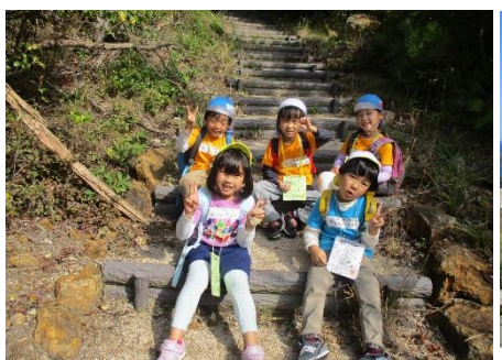
ゴールは間近、ミッションもあと一つ。その前にグループ写真。