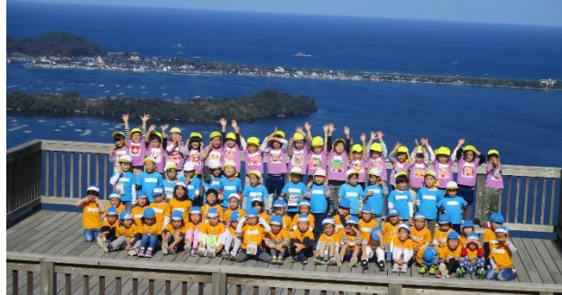
みんなそろって記念写真。この後、お弁当です。

今年も実施できた5歳児交流会。5歳になると、ずいぶん遅くなり、長い坂道を子どもだけのグループで登って行きます。すごく良い天気で、久美浜湾が一望できたり、眼下に見覚えのある家並みや建物が見えたりします。子どもたちの心に残る久美浜ならではの取組となっています。3園所を混ぜたグループをつくることは、事前準備が大変ですが、新しい友達ができるよい機会になっています。