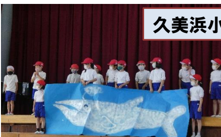
1年「仲よし1年生の1日」くじらぐもがきた