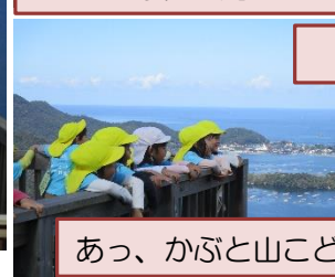
あっ、かぶと山こども園が見える。

かぶと山公園に集合し、みんなで元気に歌を歌いました。3園所混合で、15のグループとなり登山を開始しました。途中、何か所かのミッションがあり、友達同士で言葉を交わしたり、協力したりしながらクリアし、登頂。展望台から見る久美浜湾は素晴らしい景色でした。仲良くなったグループでお弁当を食べたり、熊野神社に参拝したり、名刺交換をしたりして、思い出たっぷりのひと時を過ごしました。