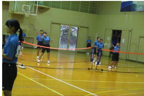
部活動の紹介をします。短い時間ですが、説明を入れ実演もします。