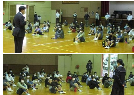
校長先生、生徒会長のあいさつです。