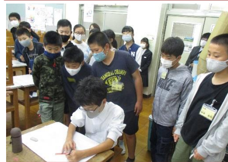
室内の部は、グループごとに活動の様子を見学させていただきました。

(感想)私はもともとこの部に入ろうと思っていた部活があったのですが、この部活動見学で、「あっ、この部活も楽しそう」と思ったりしました。どの部活も楽しそうで、とても楽しみになりました。