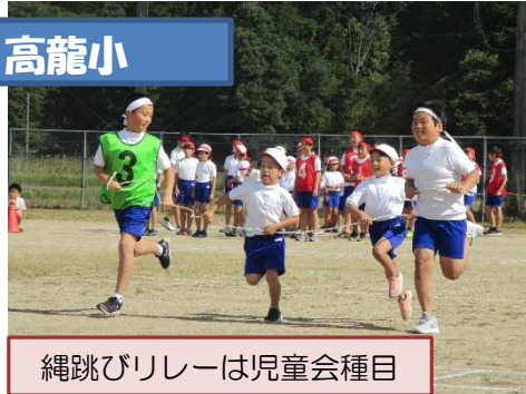
縄跳びリレーは児童会種目