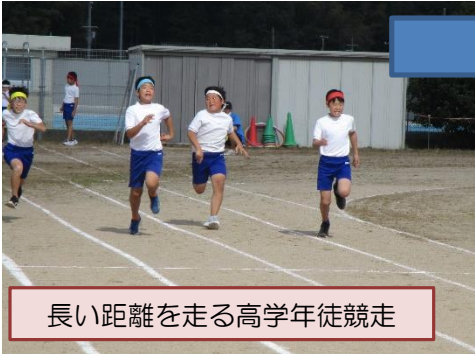
長い距離を走る高学年徒競走