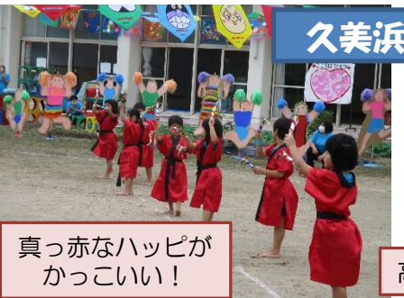
真っ赤なハッピーが かっこいい!