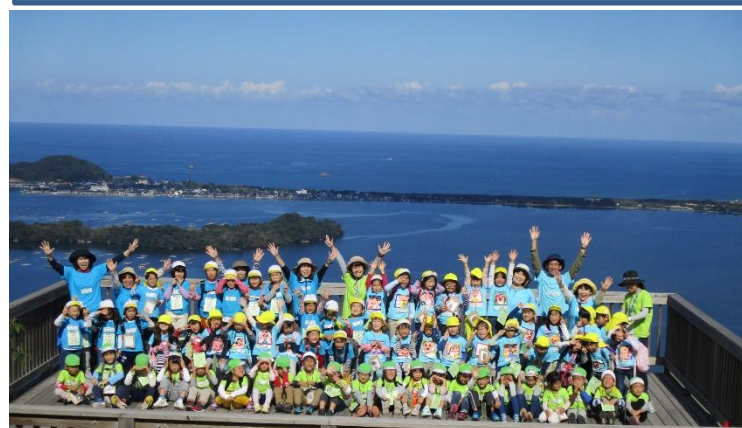
すごい景色で気持ちいい！山頂で全員そろって記念写真