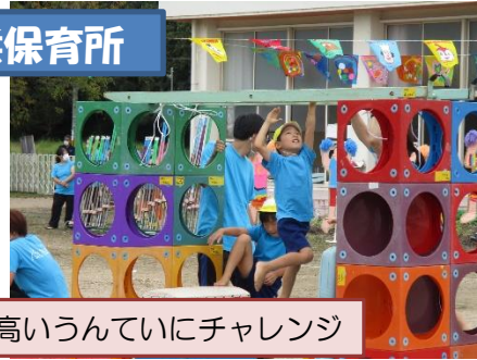
高いうんていにチャレンジ