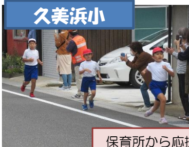
保育所から応援に来てもらったマラソン大会