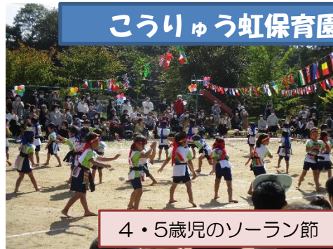
4・5歳児のソーラン節