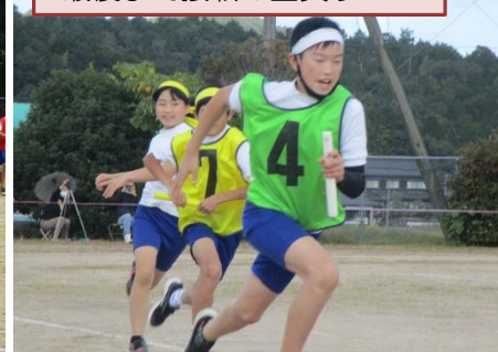
最後まで接戦の全員リレー

秋のスポーツ祭と名付けられて、3種目の競技をし、チームで競い合いました。チームで励ましたり、教えたり、協力したりする行事がなかなかできない中でしたが、笑顔で一生懸命頑張った子どもたちでした。