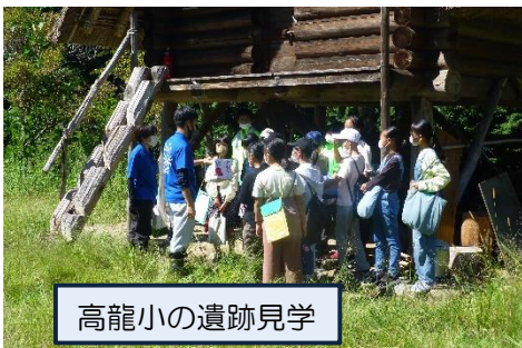
高龍小の遺跡見学