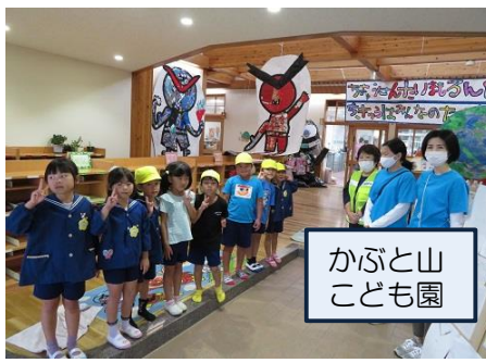
かぶと山こども園