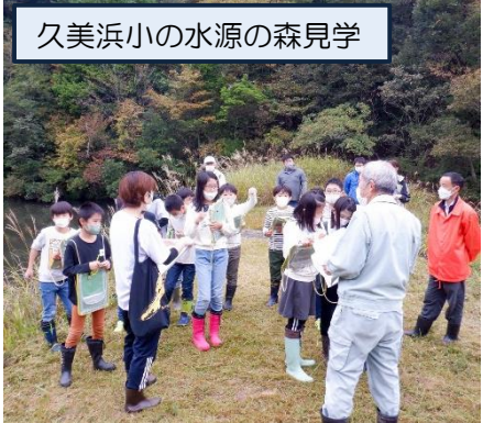
久美浜小の水源の森見学

高龍小は、文化庁の「つなごうプロジェクト」の一環として「地域のことを学んで発信」という学習をしています。地域の遺跡を見学しました。久美浜小は「水源の森」の学習を進めています。