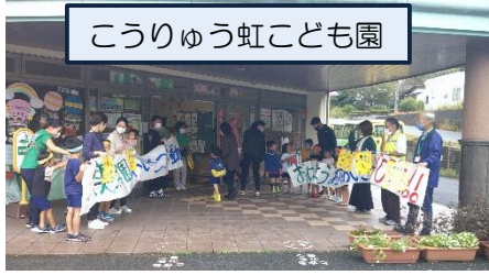
こうりゅう虹こども園