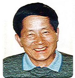
昭和29年高麗中学校卒業 東京久美浜同窓会副会長