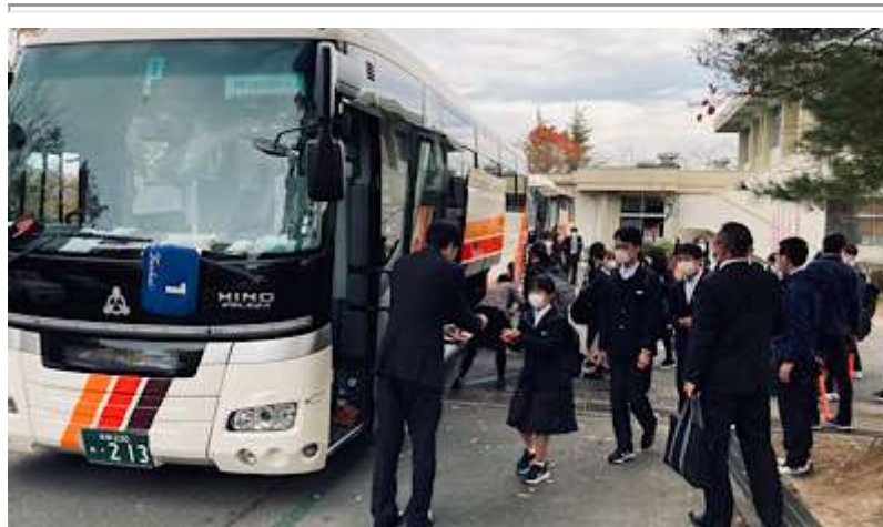
【7:45配信】おはようございます！秋晴れの爽やかな朝、集合時間にバツ