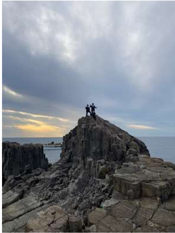
M学年主任撮影のベストショット！