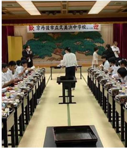
女将さんが直々にご挨拶。