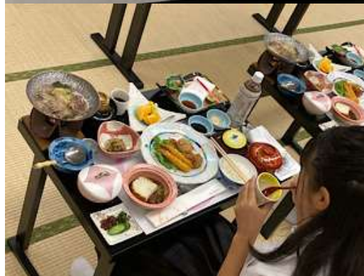
お料理の説明中です！