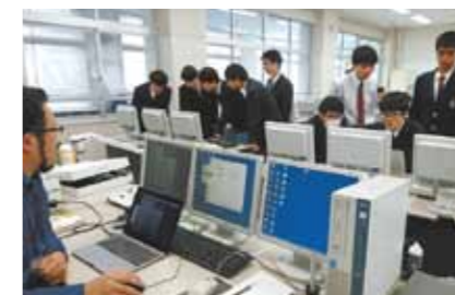
地元企業による社会人講師授業