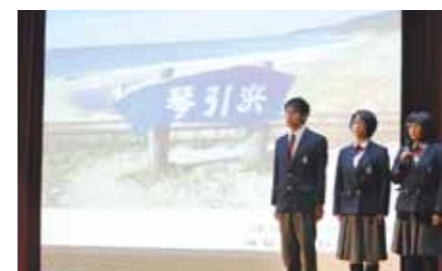
丹後活性化プレゼンテーション大会