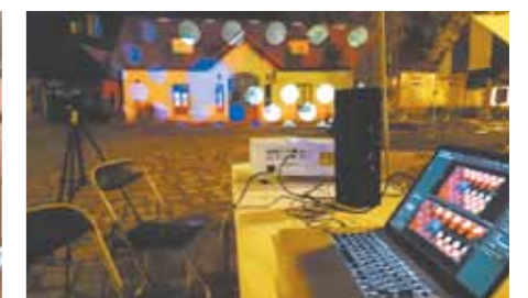
プロジェクションマッピング実演