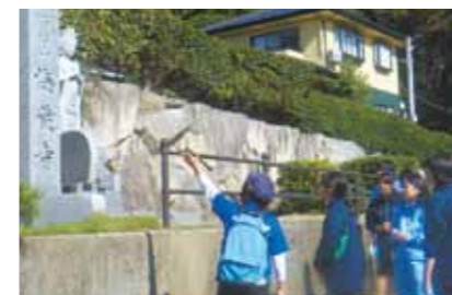
京都すばる高校と地域研究

地域に密着した授業を展開 「丹後活性化プレゼンテーション大会」の実施 「丹後日帰りツアー」の企画 「商品開発」「接客販売実習」など