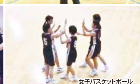
女子バスケットボール