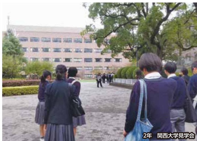
2年 関西大学見学会