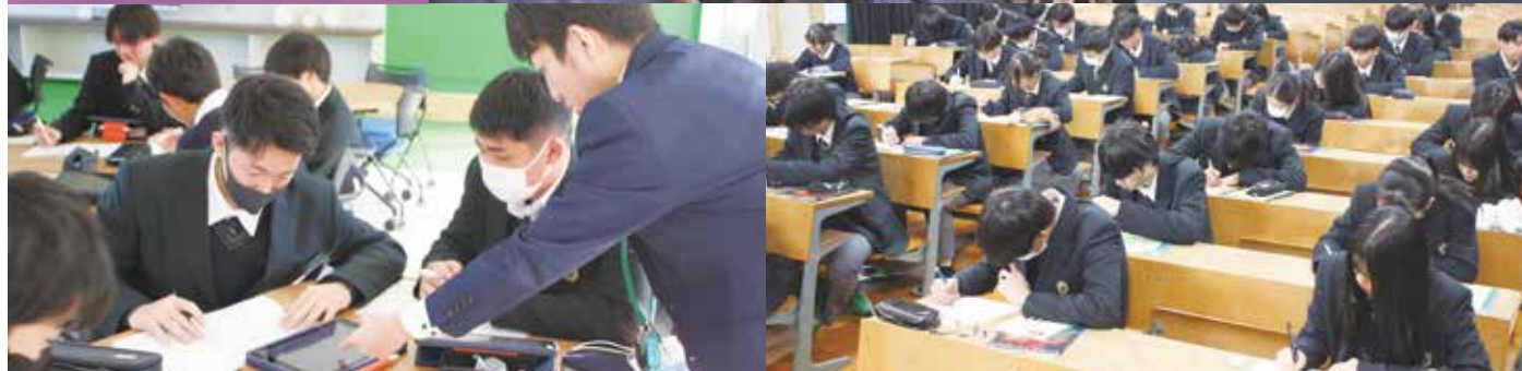
[令和8年度入学生教育課程]