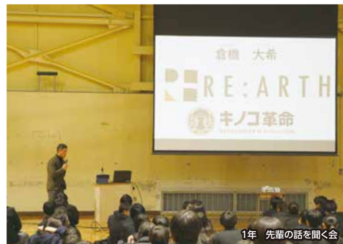
1年 先輩の話を聞く会