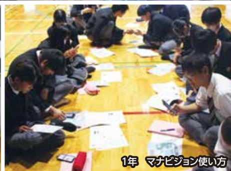
1年 マナビジョン使い方