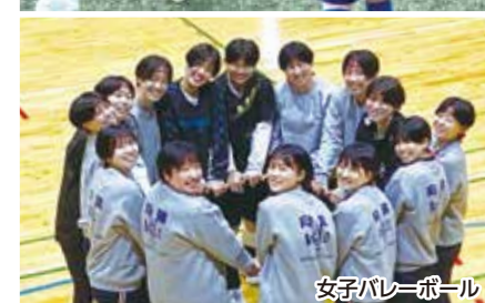
女子バレーボール