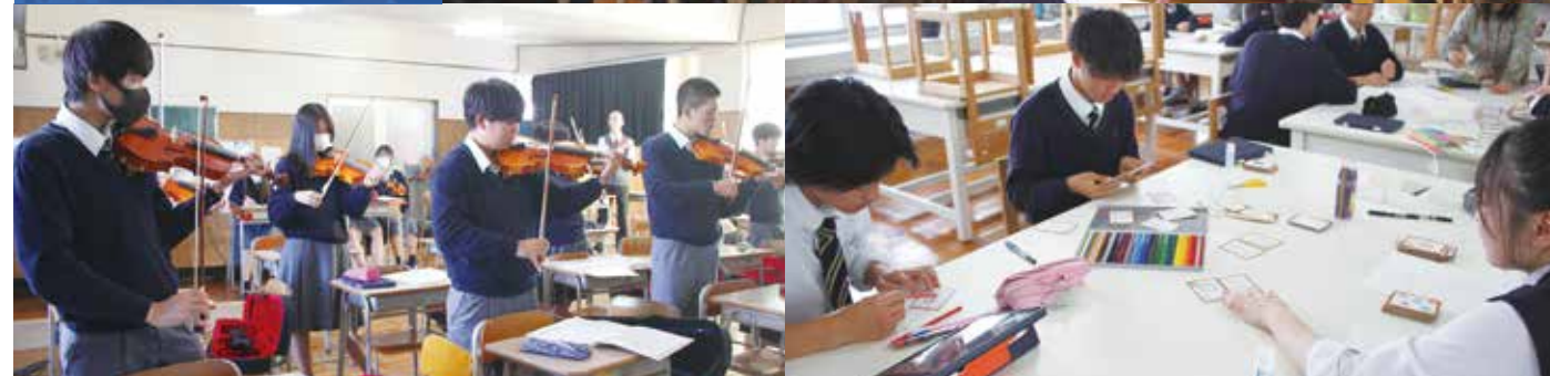
[令和8年度入学生教育課程]