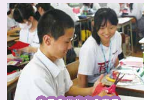
香港の学生との交流