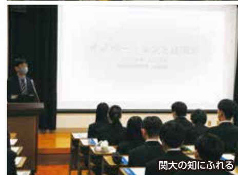
関大の知にふれる