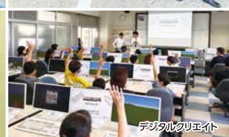
デジタルクリエイト