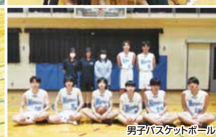
男子バスケットボール