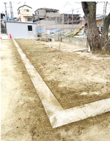
造園中のクローバー園

はたしてその目標点はいつ子どもたちの心に芽生え、育まれるのでしょうか。身近な目標とともに、生涯にわたる大きな目標に出会わせたいものです。