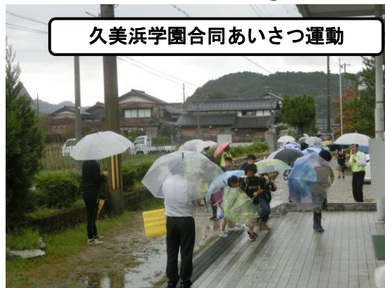
久美浜学園合同あいさつ運動