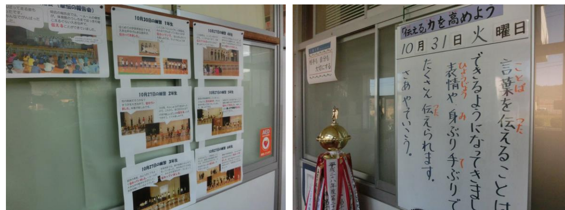
校内掲示も工夫して「伝える」を全校で意識してきました。