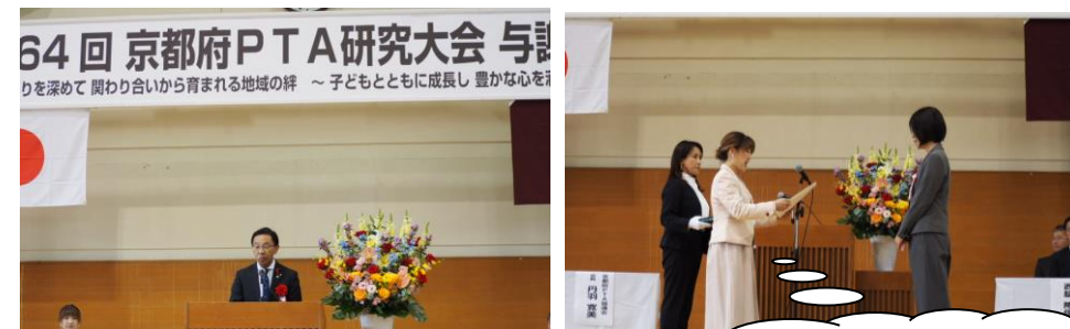
第64回京都府PTA研究大会 与謝大会