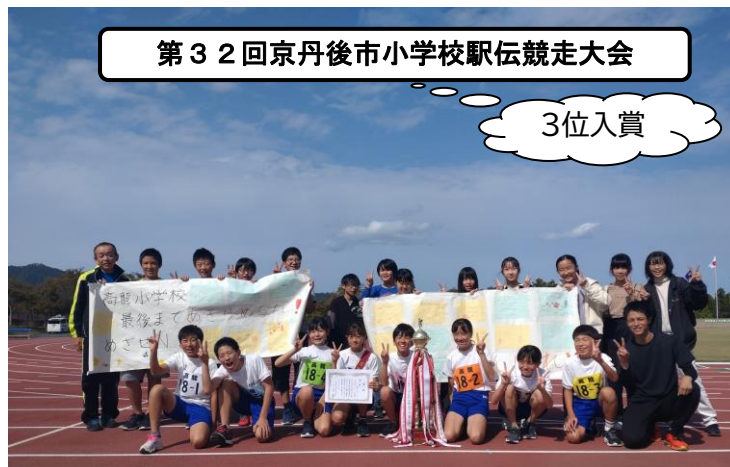
第32回京丹後市小学校駅伝競走大会