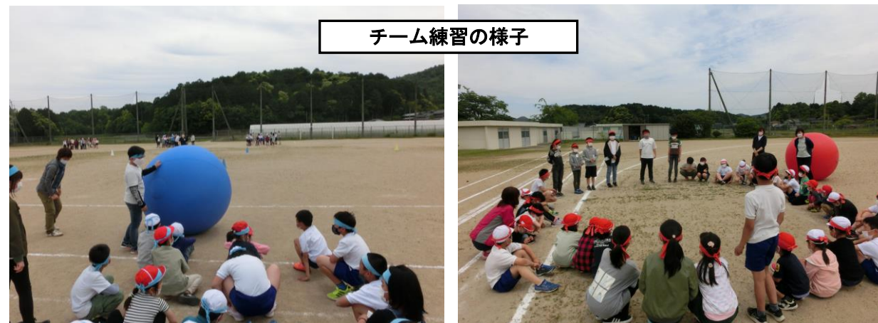
チーム練習の様子

練習に必要な道具の準備や片づけは5年生が担うなど、5年生は6年生をサポートしてくれていました。