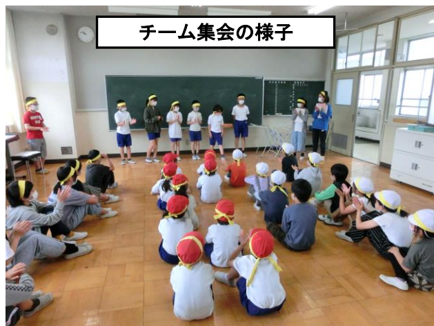
チーム集会の様子

チーム集会では各チームの1年生から6年生が集まり、全員が自己紹介を行い、チームの目標を確認したり、並び順を確認したりしました。進行はすべて6年生が行いました。「集団の中で適切に行動できる力」や「学年を超えて協力し合える関係」も運動会を通して育みたい力です。