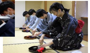
松花堂での茶道体験