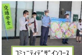
コミュニティデザインコース