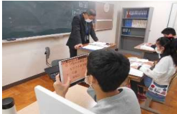
<タブレット端末の使用>