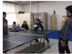
<近畿盲学校卓球大会参加>

陸上・水泳、総合フィットネス、球技(フロアバレーボール、ゴールボール)、サウンドテーブルテニスがあります。近畿の盲学校の大会に出場しています。