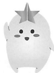
北嵯峨高校マスコットキャラクター「ありす」

北嵯峨高校の校地のすぐ西側を流れている有栖川の妖精。尻尾が有栖川の土手にたくさん生えているタンポポになっている。