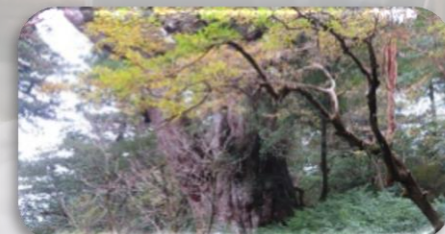
縄文杉トレッキングツアーを完遂