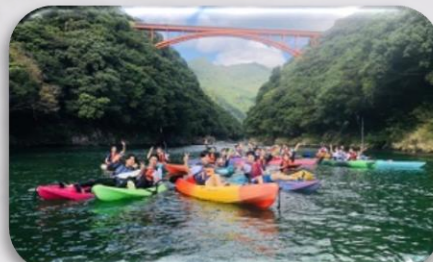
安房川カヌー体験