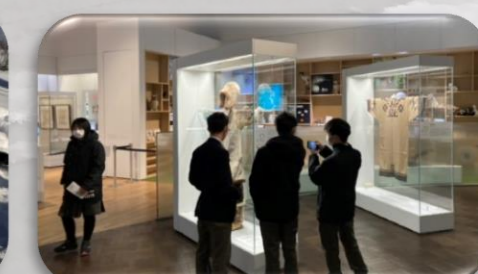
アイヌ資料館を見学