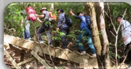
#屋久島踏破してみた