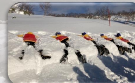
スノーシュー体験・・・？