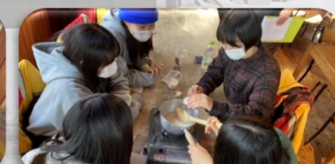
生キャラメル作り