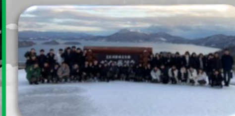
洞爺湖と奥に広がる山脈

12/11（日）～12/14（水）、普通科2年生がニセコ・小樽方面へ研修旅行に行ってきました。洞爺湖・有珠山・ニセコなどを訪問しました。屋内では、ガラスリッツェン&キャンドル作りや焼き絵皿&生キャラメル&アイスクリーム作りを、屋外では、アスレチックを楽しむ班とスノーシューを行う班に分かれて活動しました。また、小樽・札幌市内での班別研修は、友人との楽しい時間となり研修と観光のハイブリッド型研修プログラムは行程全体にメリハリが付き、充実した旅行となりました。