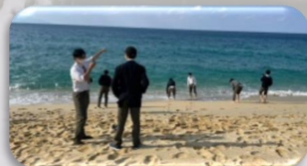
永田いなか浜にて

今年は、屋久島滞在型の研修プログラムとし、屋久島の木と深く関わった文化についての理解を深めたり、カヌーに乗って探検するなど充実した研修旅行となりました。屋久島の【屋久杉】と北桑田の【北山杉】は両方とも全国でも有名なブランド杉であり、杉と深く繋がる地域を訪ね、貴重な発見が数多くありました。