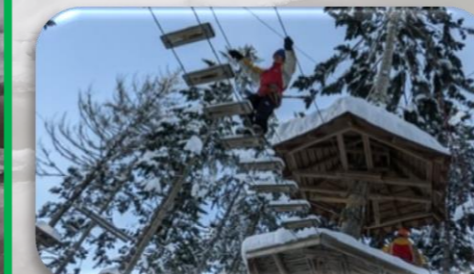
雪のアスレチック体験