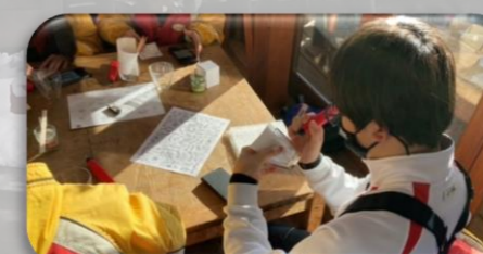
ガラスリッツェン作り