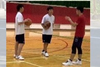
練習のときも話し合いを大事にしています。

自ら考え、自ら行動する力を身につけながら楽しんで部活動に取り組んでいる姿が見られます。