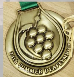
デフリンピック銅メダル