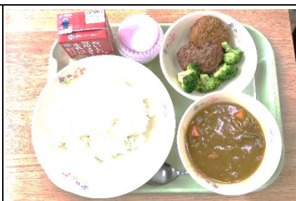
3年生お祝い給食を24日に実施しました。