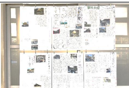
2年生校外学習の壁新聞が完成し、教室前に掲示しました。