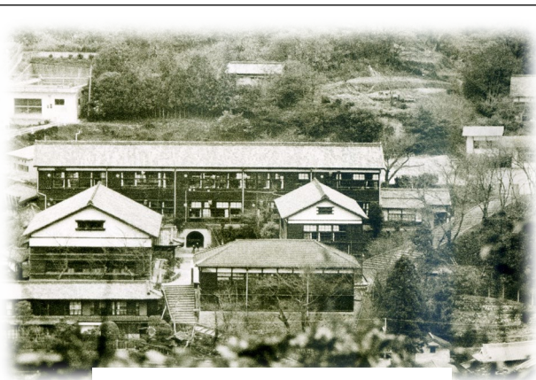
昭和 47 年 4 月当時の笠置小学校