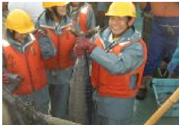
大きな魚が捕れました。「鱸」でしょうか？大満足の表情が印象的です！