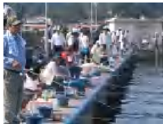
本校棧橋は参加者で埋め尽くされました。釣果はどうだったのでしょうか。

本校棧橋において「障害のある人の体験講座」が実施されました。天気も好く多くの方に参加していただきました。スムーズに講座が進行するよう、教職員・生徒がボランティアとして参加し、魚釣りのお手伝いをさせていただきました。参加された方々との触れ合いをとおして、生徒自身が何かをつかむよい機会になったのではないのでしょうか。