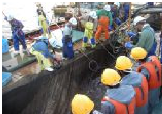
定置網があがってきました。生徒達にとっては非常に緊張する瞬間です。

学校全体としてはこの交流会も今回で6回を数え、回を重ねるごとに漁業士の方々と交流も深まり、生徒達の漁業への理解も一層深まってきているのではないかと思います。2年生海洋科学科としては初めての交流会ですが、9月14日(金) 養老沖で漁業士交流会の一環として、定置網実習を体験しました。