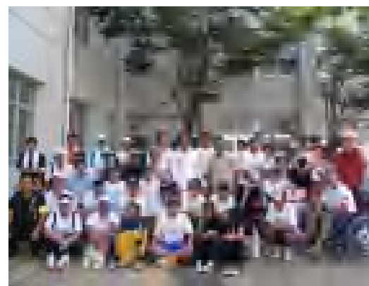
最後の記念撮影です！皆さんよい表情をされています。