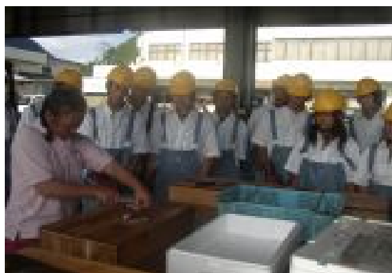
漁業士の方に魚のさばき方を教えていただいています。みんな真剣に手さばきを見ています。