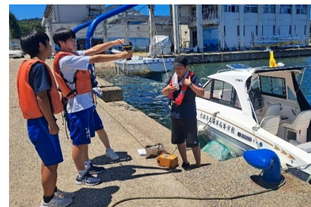
小型船舶操縦士 実技講習