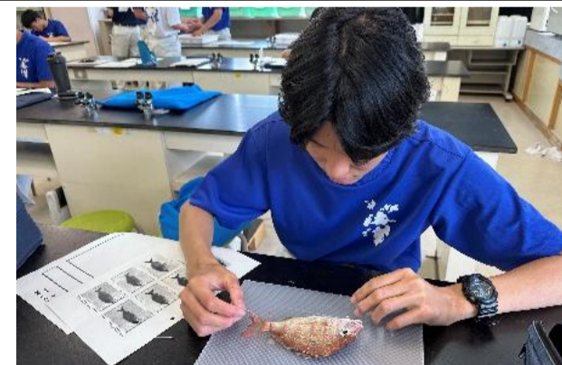
栽培漁業技術検定 実技試験対策