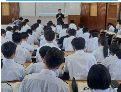
資格オリエンテーション