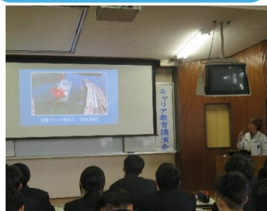
キャリア教育講演会