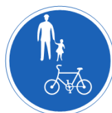
普通自転車歩道通行可

「普通自転車歩道通行可」の標識や標示がある場合、普通自転車は歩道を通行することができます。