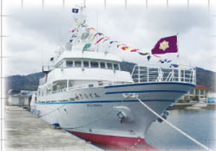
浮かぶ教室 実習船「みすなぎ」185t