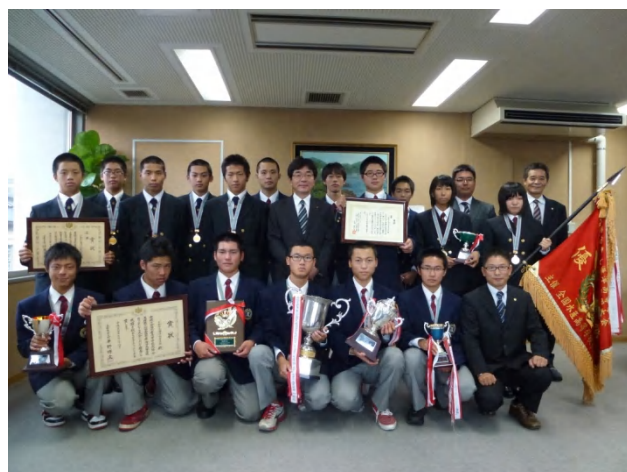
田原教育長と記念撮影