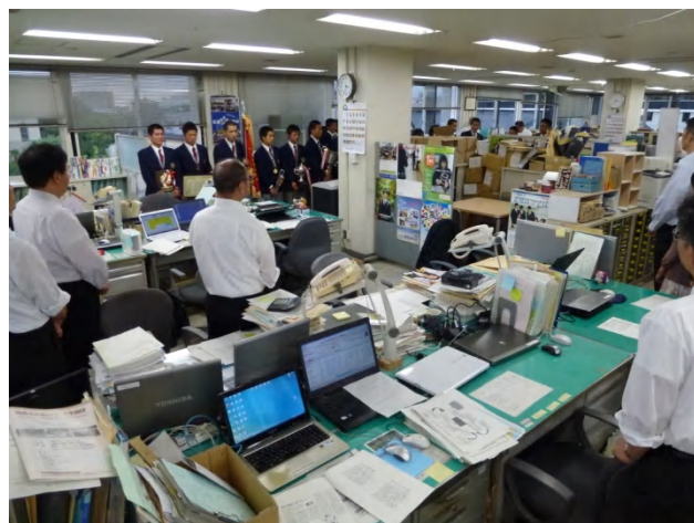
高校教育課へ報告