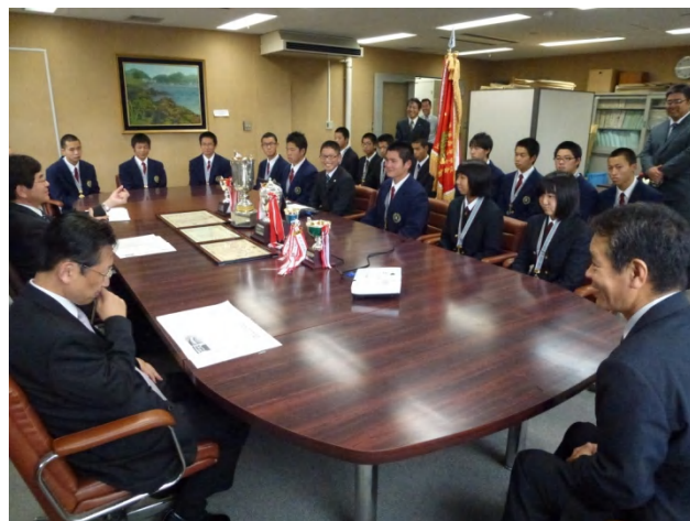
大会の様子をビデオで観覧