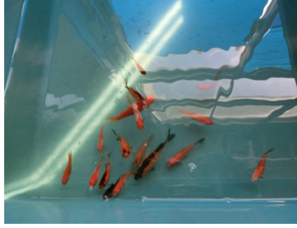
[ 2色のワキン ]

ワキンの繁殖を続けて4年になり、昨年は体色に白が混ざり、今年は黒が混ざりようになりました。このワキンだけを選別して繁殖させ、マリンバイオ部産の3色ワキンができればと思っています。いつになるかは分かりませんが、頑張ります。