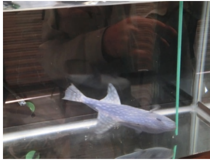
[ サイフォンを噛む ]