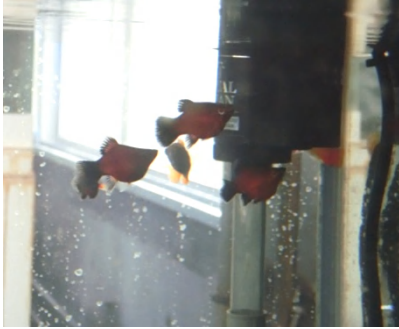
[ プラティ・親 ]