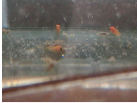
[ 稚魚 ]

10月に購入したレッドワグバルーンプラティ（♂2匹・♀3匹）が初めて19匹の仔魚を産みました。グッピーほど簡単には繁殖できず、どうしたらいいのかと思っている時に産まれたので安心しました。グッピーに続き繁殖を目指しています。