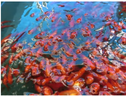
[ ワキン（姉金） ]