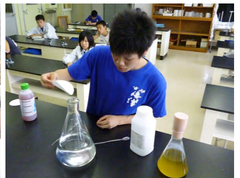
【プランクトン培養実習】

今回の集中実習では、担当魚種の管理、イワガキの人工授精にむけた準備、ヒラメの人工授精、顕微鏡観察などを行い、専門性の高い内容になりました。