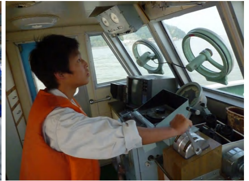
【実習船「かいよう」操船】