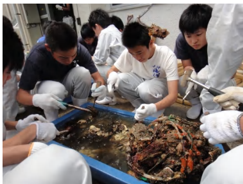
【イワガキ付着物除去】