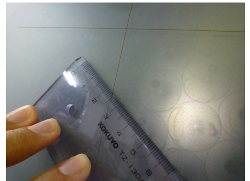
【産卵量の計算と卵径測定】

4月19日(火)に産卵した量は約38万粒で、このうち4万粒を飼育水槽へ収容しました。卵径は0.97mmでした。