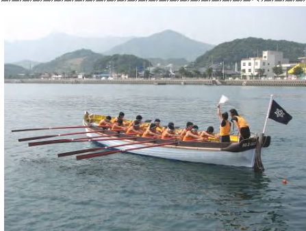
海も教室(カッター)

: 施設見学、体験会(栗田湾航海、食品加工、栽培・測量体験、カッターなどを予定)、個別相談会、黒潮寮・部活動見学