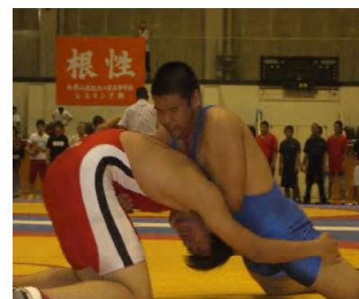
躍進する部活動(レスリング)