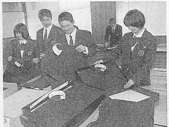
福島県立いわき海星高校に贈る制服を点検する生徒会の役員ら (府立海洋高校で)

東日本大震災で被災を受けた水産・海洋系高校の仲間を支援しようと、府立海洋高校 (宮津市) が、福島県立いわき海星高校 (福島県いわき市) に男子の学生服を贈ることになり、13日、生徒が発送した。